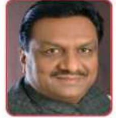
मा0 आयुष मंत्री 30प्र0 सरकार

शरीर की रोग-प्रतिरोधक क्षमता बढ़ाकर सभी प्रकार की संक्रामक बीमारियों से बचाव में सहायक है निर्देश - इस काढ़ा का प्रतिदिन ताजा बनाकर चाय के स्थान पर प्रयोग करें। कोविड-19 संक्रमण से बचाव हेतु आयुष कवच-कोविड-19 एप प्ले स्टोर से डाउनलोड करें। इसकी रेटिंग भी करें।