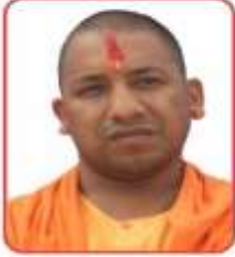
मा0 मुख्यमंत्री 30प्र0 सरकार

समसपुर चुनार, मीरजापुर (30प्र0) आयुष विभाग, उत्तर प्रदेश