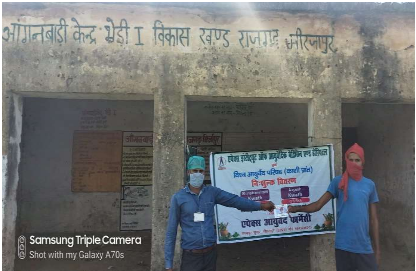
Samsung Triple Camera Shot with my Galaxy A70s