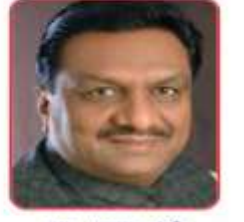
मा0 आयुष मंत्री 30प्र0 सरकार