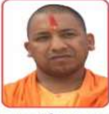
मा0 मुख्यमंत्री 30प्र0 सरकार

समसपुर चुनार, मीरजापुर (30प्र0) आयुष विभाग, उत्तर प्रदेश