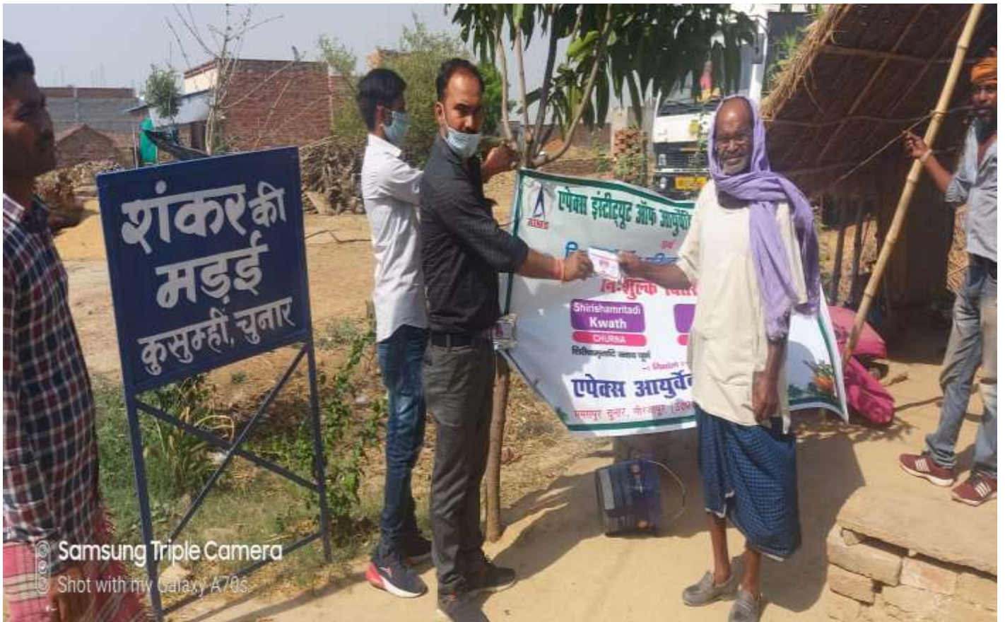
Samsung Triple Camera Shot with my Galaxy A70s