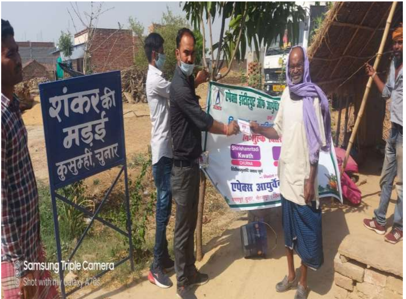
Samsung Triple Camera Shot with my Galaxy A70s