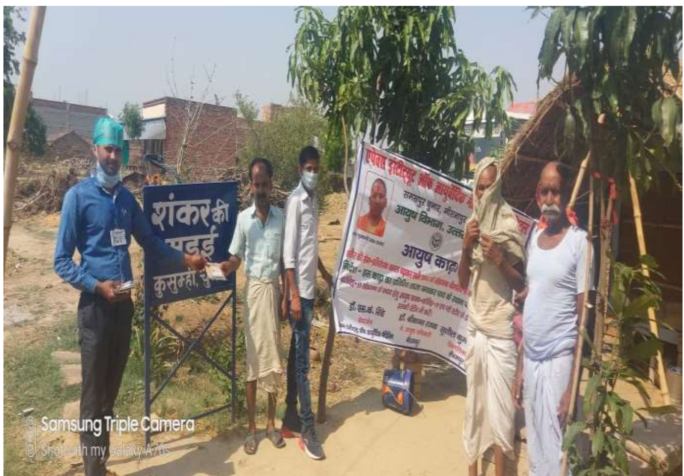
Samsung Triple Camera Shot with my Galaxy A70s